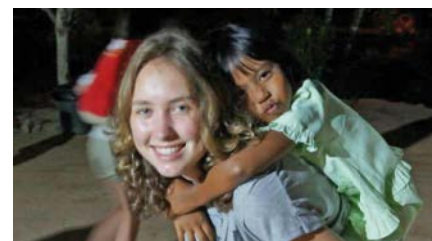
Extra curricular activities