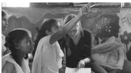
The world at your feet